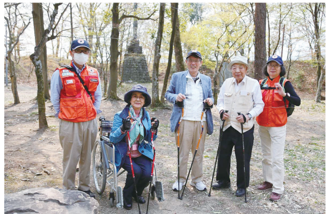
Aグループ お館様の散歩道