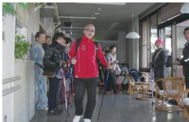
座学の後には実習です！