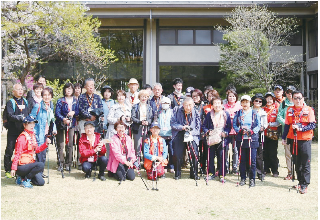
『100才までウォーキング』の皆様 常磐ホテル庭園でノルデック！